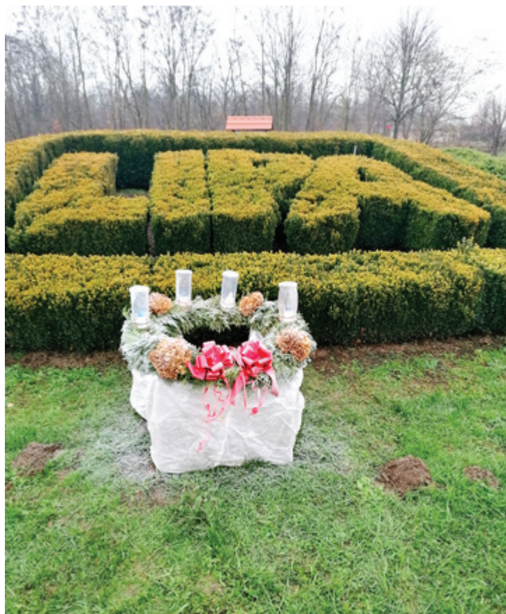
Adventni venček KS Lipa.