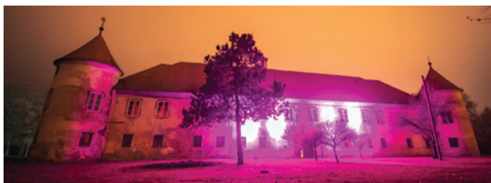
Prav tako je v znak podpore Občina Beltinci minulo nedeljo pristopila k osvetlitvi grajskega poslopja v violično barvo - svetovni dan boja proti raku trebušne slinavke.