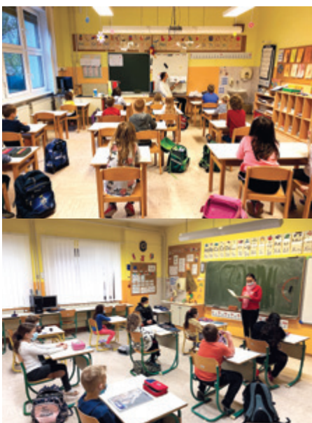
Učenci so na temo slikanice Deklica in general ustvarjali v likovnih in literarnih delavnicah