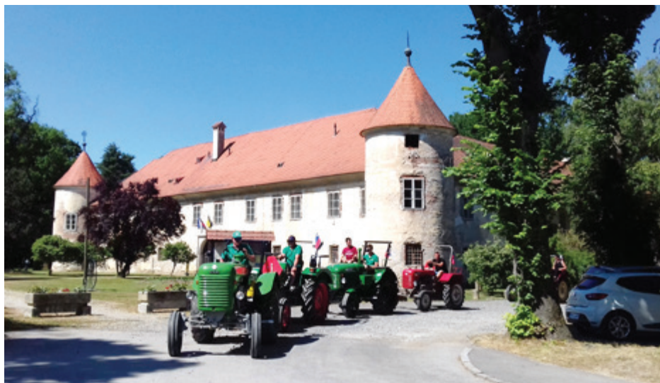
Mednarodna panoramska vožnja s starimi traktorji in drugimi prevoznimi sredstvi.

Po sprostitvi ukrepov NIJZ so se le odločili za vožnjo in druženje ljubiteljev stare kmetijske in ostale tehnike, kajti po enem letu je v vseh članov tlela želja, da bi se popeljali na panoramsko vožnjo. Popeljati so se praznično obleči v nekdanja stara oblačila, to je bil čar za vsakega udeleženca vožnje. Klub ljubiteljev stare kmetijske in ostale tehnike Pomurja – Beltinci ima tesne prijateljske stike s