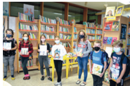
Učenci, ki berejo letos v Naši mali knjižnici.

nositi maske. Knjige berem tudi doma. V knjižnici se lahko sprostim in imamo mir. (Liza)