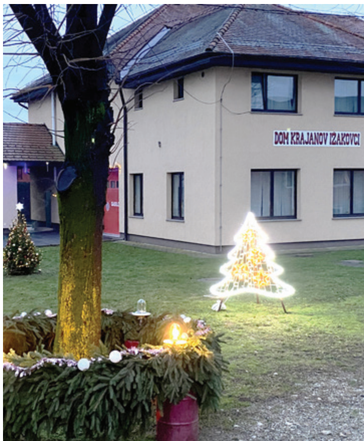
Adventni venček KS Ižakovci.