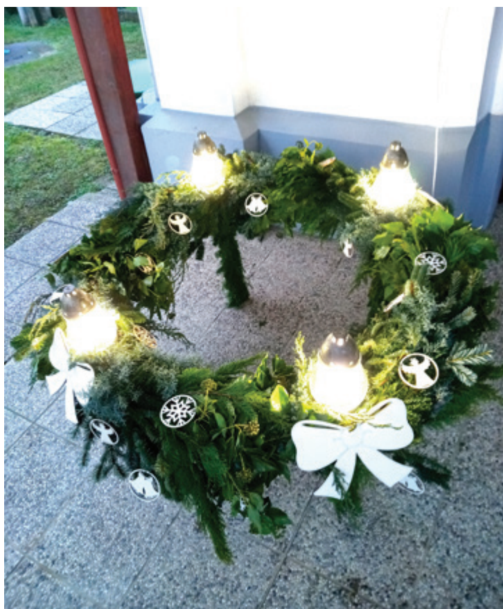
Adventni venček pri kapeli Melinci, oblikovali člani KUD Melinci.