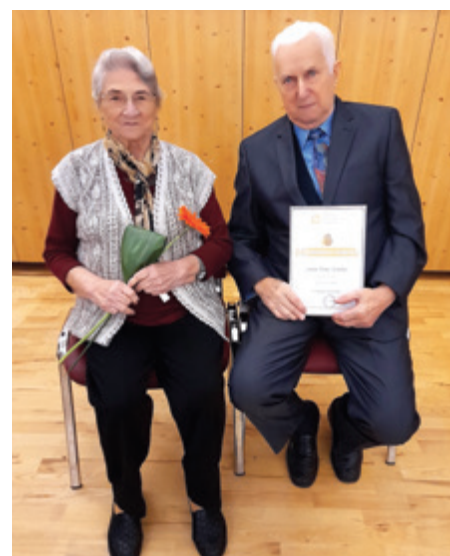
Biserno poročenca 2021.