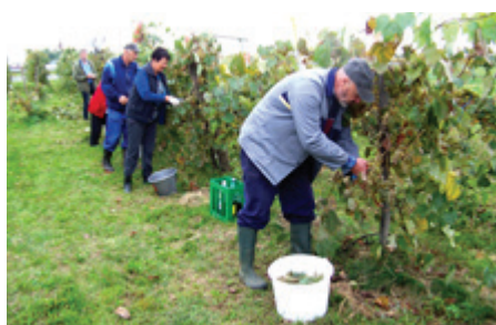
Pred trgatvijo so se najprej brali na jutranjem zajtrku, nato pa so se razdelili v vrste in začeli s trgatvijo.

Iz bio grozdja - samorodnice - so stisnili okrog 600 litrov sladkega mošta