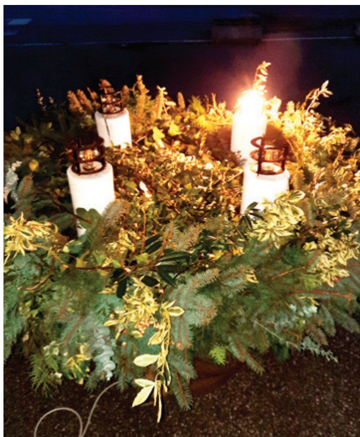
Adventni venček KS Gančani.