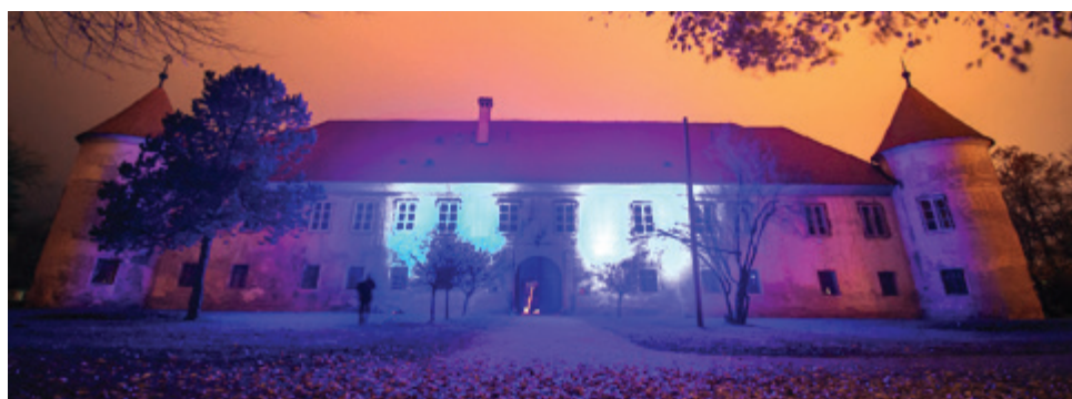
V znak podpore je Občina Beltinci minulo nedeljo pristopila k osvetlitvi grajskega poslopja v modro barvo - znak podpore bolnikov z diabetesom.