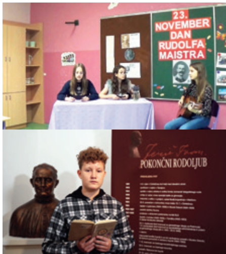
Učence OŠ Bakovci in Črt Hozjan iz OŠ Beltinci

23. novembra v Sloveniji obeležujemo državni praznik, dan Rudolfa Maistra (1874 - 1934). Na ta dan leta 1918